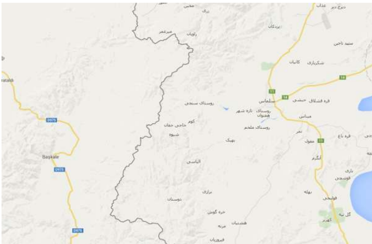
نقشه ماهواره ای منطقه عمومی سلماس

حزب دمکرات؛ نیروهای هیز آگری به همراه تعدادی از بقایای هیز حاتم در منطقه‌ی شپیران حضور نظامی و فعالیت دارند و به روستاهای گریکان، قلعه‌رش بالا و پایین و اشناک و بروشخواران در شمال غربی سلماس تردد می‌کنند که پس از اجرای عملیات نظامی و ایدایی و تبلیغات در روستاها به داخل خاک ترکیه متواری می‌شوند.