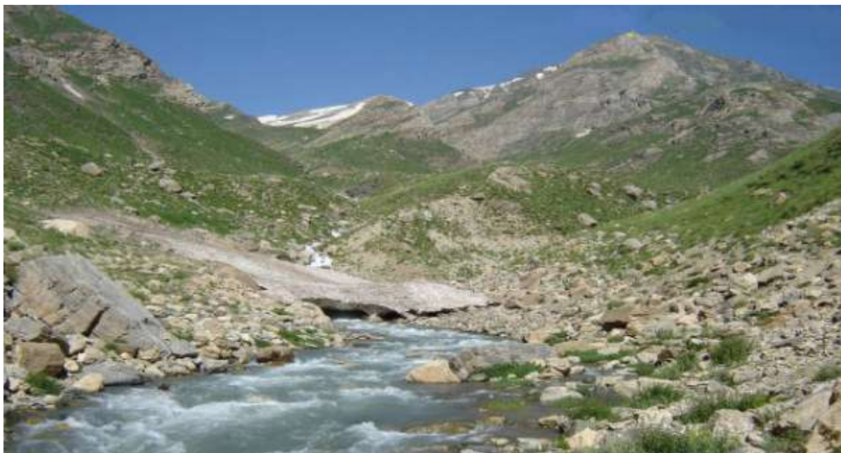
نمایی از ارتفاع قندیل در پیرانشهر

درصد مسدود می‌کند که لازم است در این ارتفاعات پایگاه ایجاد شود که این ارتفاعات به ترتیب اهمیت عبارت‌اند از: 1. شرگه. 2. قندیل. 3. کانی‌زرد.