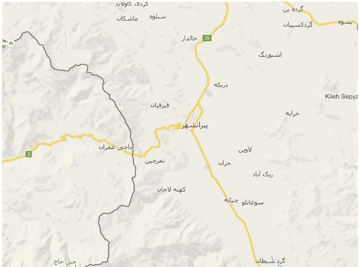
نقشه ماهواره ای منطقه عمومی پیرانشهر

ضد انقلاب برای ورود و تردد به این منطقه از چند مسیر متفاوت استفاده می‌کند که به این شرح است: