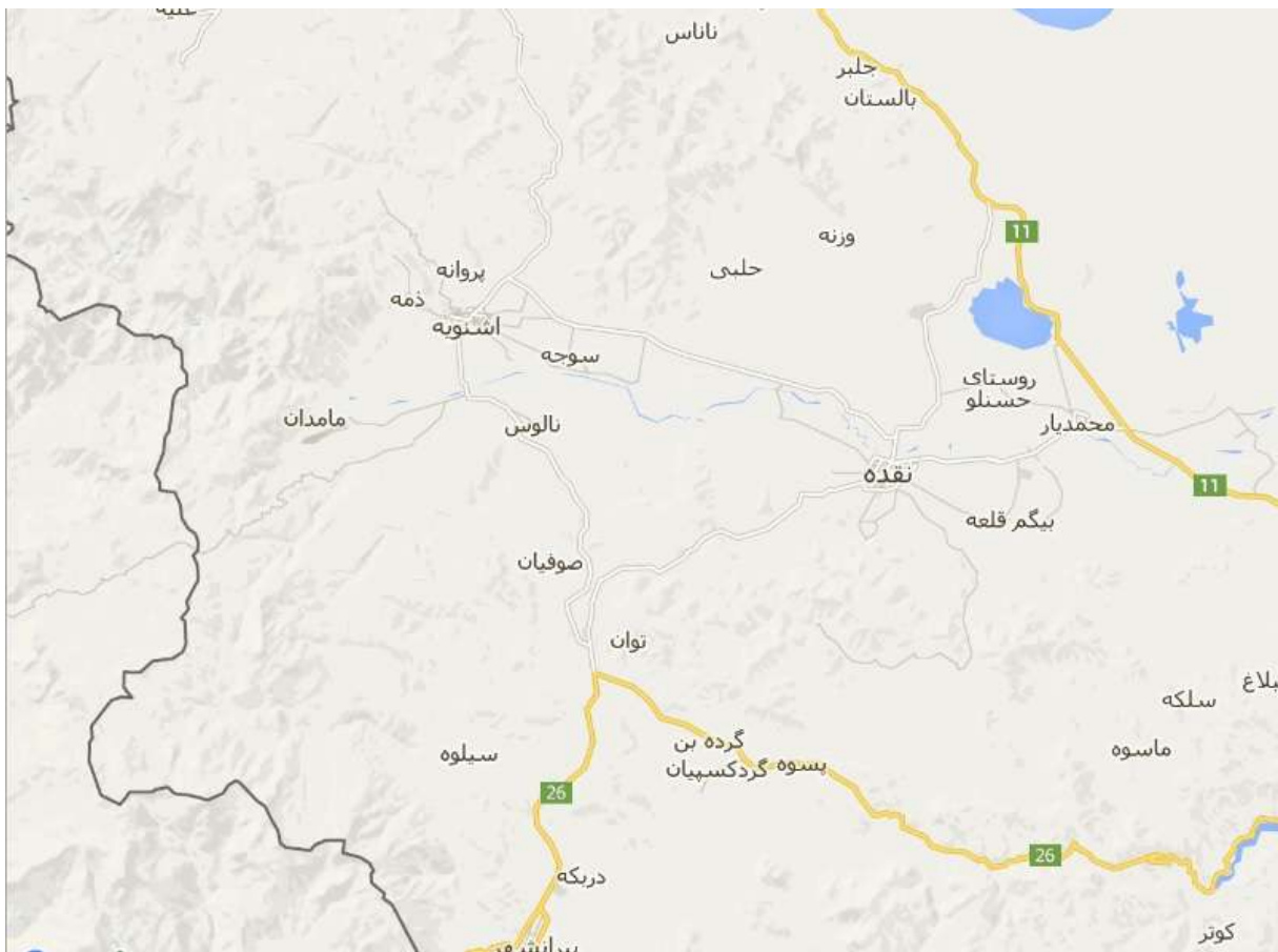
نقشه ماهواره ای منطقه عمومی نقده