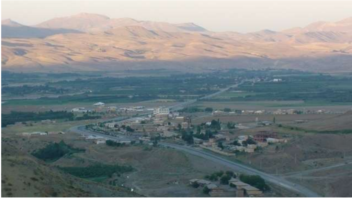
نمایی از شهر سرو