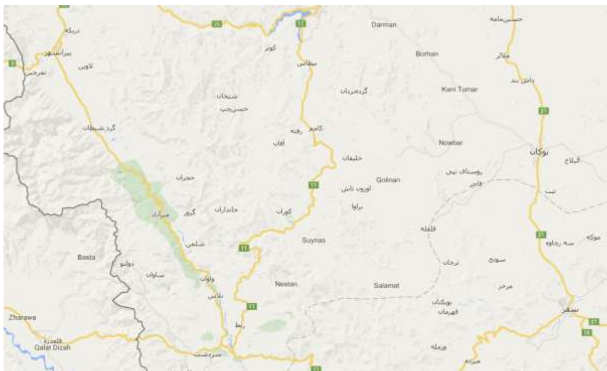
نقشه ماهواره ای منطقه عمومی بوکان

در سال جاری، نیروهای هیز 110 بیان همراه با نیروهای اربابای بانه و مالبند 2 سفز قرار بوده است که از مرز پیرانشهر وارد کشور شوند که نیروهای قنديل مسئول عبور نیروهای دیگر بوده‌اند. محل ورود، رودخانه‌ی نزدیک روستای ترکش بوده و به دلیل این‌که از طرف جمهوری اسلامی کمین‌گذاری شده بود، عبور از رودخانه غیر ممکن می‌نمود، ولی با توجه به جمع‌آوری کمین و نبود پایگاه، نیروهای حزبی از همان محل وارد مرز می‌شوند و تا روستای بانه‌سو آمده و از آن‌جا به منطقه‌ی مه‌باد نفوذ می‌کنند که به احتمال قوی بنا بر تجربیاتی که حزب در منطقه داشته است، (نبود پایگاه در مناطق فوق و کوتاه بودن مدت کمین) در سال آینده نیز از