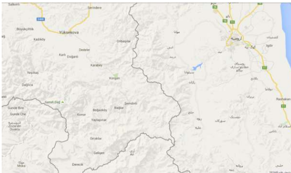
نقشه ماهواره ای منطقه عمومی ارومیه

مسیر تردد حزب دمکرات: تیم‌های 10 نفره‌ی حزب برای اجرای عملیات‌های ایزدایی از مسیرهای زیر به اطراف ارومیه اعزام می‌شوند.