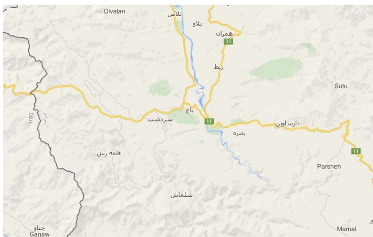
نقشه ماهواره ای منطقه عمومی سردشت

مناطق استحفاظی این شهرستان عمدتاً محل تردد نیروهای حزب دمکرات بوده که تا به حال از آنها استفاده کرده، به احتمال قوی از این به بعد نیز از این مسیرها استفاده خواهند کرد. (الف) محل تردد هیز کیارنگ از مقر سونه از مسیر اصلی سنگی توژال گذشته و به پشت روستای کانی‌زرد (شمال غربی سردشت) می‌رسد و از آنجا به دو مسیر شمال و جنوب تقسیم می‌شود.