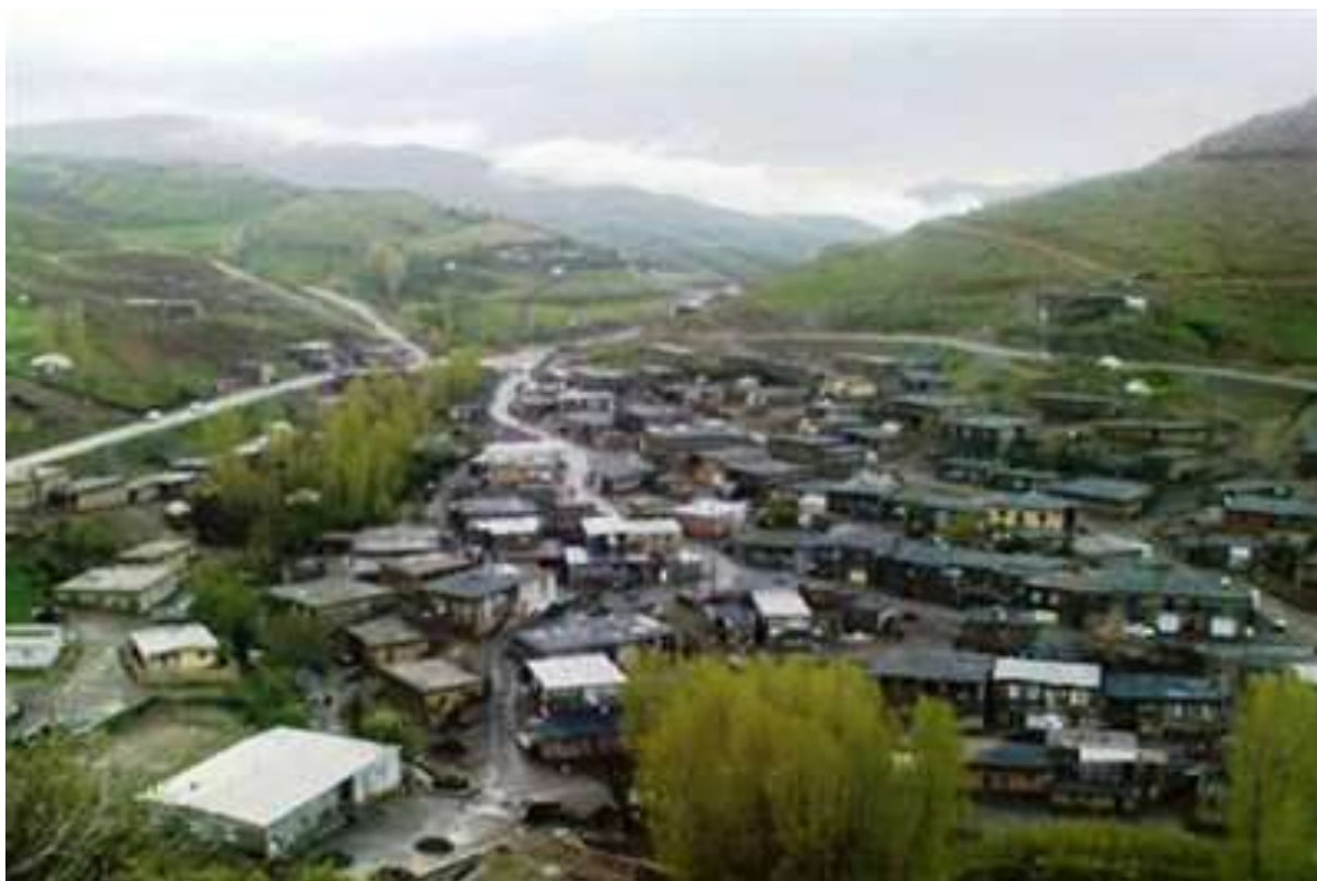
نمایی از روستای آواتان