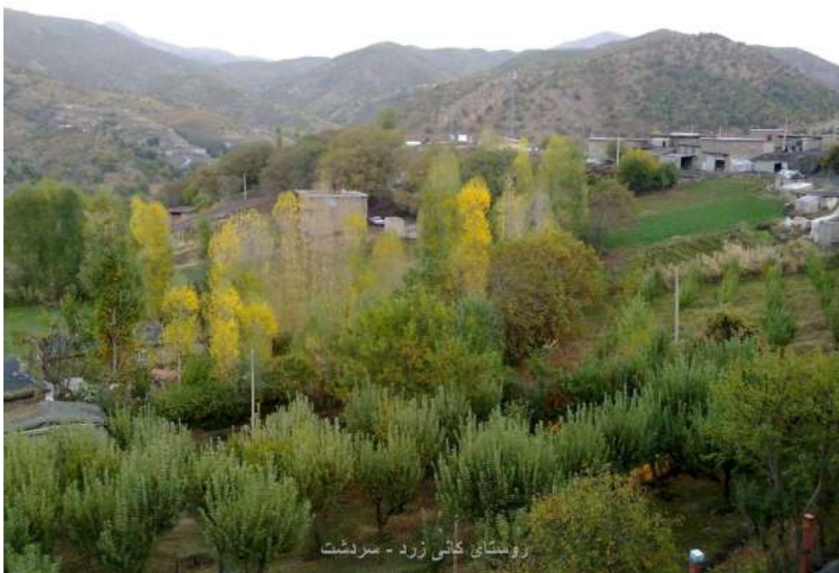
نمایی از روستای کانی زرد

ب) مسیر تردد افراد هیز زمزیران - که هم‌اکنون در منطقه‌ی مارد و رزگه‌ی عراق مستقر می‌باشند - از مسیر دشت ساوان به طرف منطقه‌ی جانداران و چولان است و آنان از آن‌جا به طرف منطقه‌ی پشت روستاهای نستان، سیسر، زمزیران (در شمال شرقی سردشت و در محدوده محور سردشت - مهاباد) می‌روند. ج) مسیر تردد پیش‌مرگان پل سردشت «کومله» که مقر اصلی آن در خندکه‌ی عراق قرار دارد.