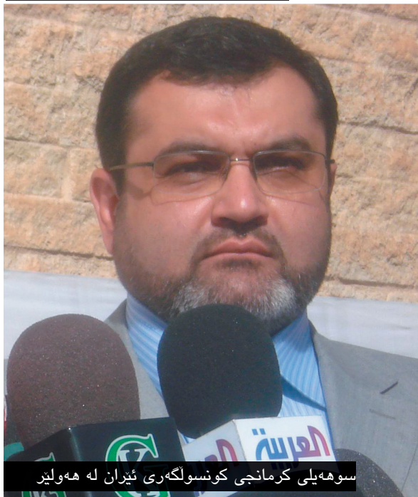
سوهه‌یلی کرمانجی کونسولگه‌ری ئێران له هه‌ولێر