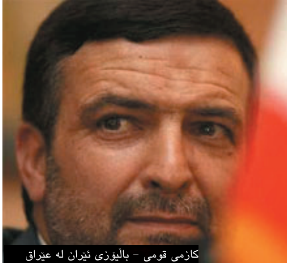
کازمی قومی - بالیوزی ئێران له عێراق

چاودێران وای بۆ ده‌چن که رێککه‌وتنی ئیستخباراتی نیوان ئه‌مریکا و ئێران، کاریگه‌ری هه‌بووه له‌سه‌ر باشبوونی ئاسایشی عێراق.