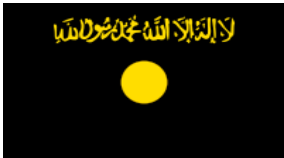
Al-qaidas flag