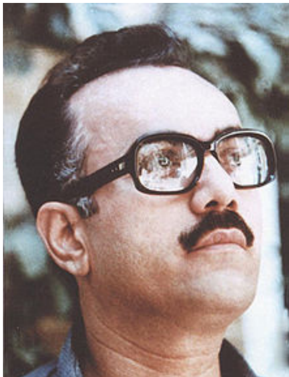
Ahmad Moftizadeh