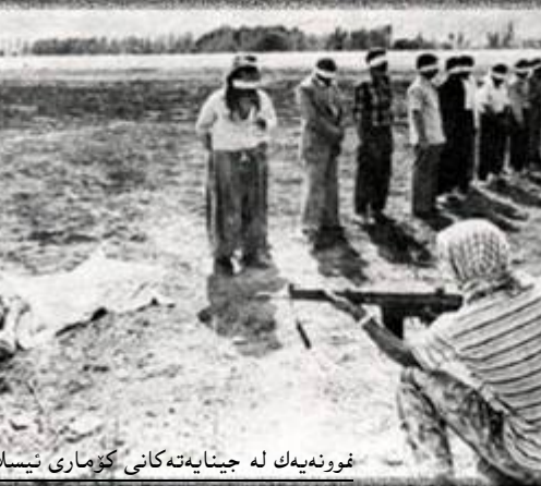
ئوونەیک لە جینایەتەکانی کۆماری ئیسلامی لە سە

کریان و گەلەکیان دیوانە، بۆ بیرواری گشتیی بگێرەوه. ھێزە جینایەتوولقیقینەکانی کۆماری ئیسلامی، بەرەندەش وازیان نەھێناو، دای وەرێختستی کۆماری خۆین، مال و دارایی خەلکی ئەو دێیەشیان تالان کردو ھەرچی یەکی بۆیان برا، ھەر لە پوول و زێر و کەلوپەلی نێو مالانەو بگرە تا ماشین و تراکتور، لەگەڵ خۆیان بردیان. کۆمەلگۆرییەک کە قەلاتان شایەدی بوو، پێشتر بە شتووبەکی زۆر بەریت لە "قارن" بەرێو چووبو! دواتریش لە زۆر دێ ناوچە دیکە کوردستان بە ھۆی چەکدارەکان و بەرکریگراوانی کۆماری ئیسلامی ھو، دووپات کرایەوه. قەلچۆی دانیشتوانی دێیەکانی سۆفیان، سەروکانی، سەوزی و سەرچارو قەرەگۆل، کوردەخانەکانی ساروقامیش، حەسەن لولان، دیلانچەرخ و کەریزە ئوونەیک لەو جینایەتە بەرینانە بوون.