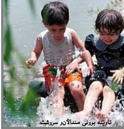
ناوێتە بوونی مندالان و سروشت