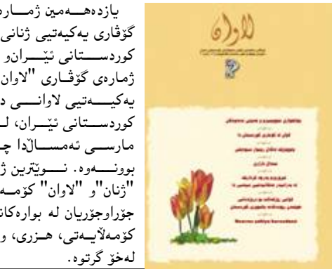
یازدەھەمین ژمارە "ژنان" گۆفاری یەکیەتی ژانی دیموکراتی کوردستانی ئێران و بیستەمین ژمارە گۆفاری "لاوان"، نۆرگانی یەکیەتی لاوانی دیموکراتی کوردستانی ئێران، لە کۆتایی ماری ئەمەسەل دا چاپ و بلاو بوونەوه.

یازدەھەمین ژمارە "ژنان" گۆفاری یەکیەتی ژانی دیموکراتی کوردستانی ئێران و بیستەمین ژمارە گۆفاری "لاوان"، نۆرگانی یەکیەتی لاوانی دیموکراتی کوردستانی ئێران، لە کۆتایی ماری ئەمەسەل دا چاپ و بلاو بوونەوه. نوێترین ژمارەکانی "ژنان" و "لاوان" کۆمەلەیک بابەتی جۆراوجۆریان لە بواری کانی سیاسی، کۆمەلەیی، ھەزری، وەرزی و... لەخۆ گرتووه.